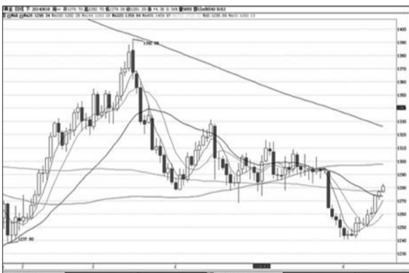
分析师认为本周金价将大幅下跌。

上周国际现货黄金如期发生反弹,均线由发散趋向收紧,短期均线多头排列,日线级别形成小级别的上升通道,角度较大。MA144均线现面临回抽,前期由于次均线被顺利下破,故我们认为中期空头趋势已成,前期笔者判断整理形态是下降中继,也被事实证明是正确的,故依然延续之前的判断,每次下跌过后,都将面临整理,每次上涨都是空单入场的好机会,下降三角形破位以后,通常