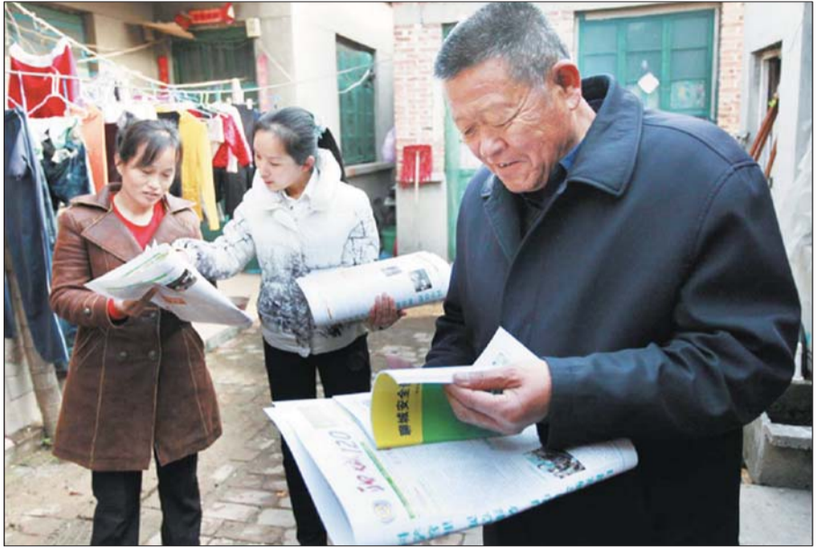
本报联合市120急救中心向市民讲解安全取暖，预防煤气中毒。(资料片)

自2012年冬季以来，本报开展了温暖水城入户宣传预防煤气中毒活动，在报纸上开辟专栏，宣传煤气中毒预防知识，到煤气中毒高发区发放《安全手册》，活动受到市民的欢迎，煤气中毒事故逐年下降。