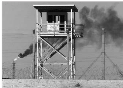
6月18日,反政府武装开始对伊拉克最大的拜伊吉市炼油厂发起进攻。这是2003年10月6日摄于该炼油厂的照片。

据报道,目前在伊拉克的中资机构主要是由中海油投资的米桑油田群,中石油投资建设的艾哈代布、鲁迈拉、哈法亚、西古尔纳等四个油田,上海电气在伊拉克的发电项目,中国建材承建的水泥厂,以及中水电等中资承包建设的基础设施项目。另据财新网报道,截至目前,经过单独签订、收购以及伊拉克政府的四次公开招标,中国油企在伊拉克石油开采项目中已经占据最大份额。美国《福布斯》网站15日的报道甚至认为伊拉克的麻烦甩给中国来解决,因为“中国在伊的利益远比美国多”。(宗禾)