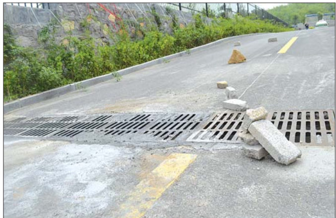
事发地雨水算子已经被修好。

本报6982110热线消息(记者 路伟) 18日凌晨4点30分左右,在天平街道办事处澎湖湾小区东侧,