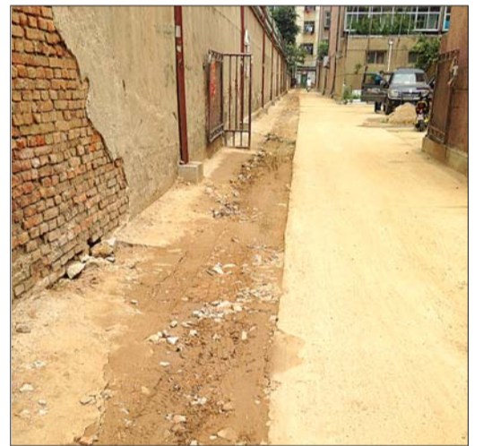
挖开的路面下雨后冲出很多泥土。

本报泰安6月18日讯(记者 邢志彬) 岱宗大街东段路北一小区,5月份挖开水泥地面铺燃气管道,铺完一直没把路面恢复,近天下雨冲得小区里一地泥土。泰山港华燃气称,是燃气隐患改造项目,正在打压测试阶段,预计一周内完工,之后恢复路面。