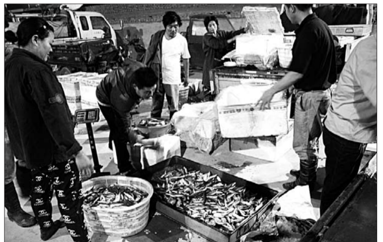
凌晨是新鱼市繁忙的时候。

本报济宁6月24日讯(记者 晋森 刘守善) 目前,新鱼市已正式搬入八里庙大桥西的运河壹号食汇城。位于老城区解放桥附近的原鱼市已不再经营,当地环境得到了明显改善。