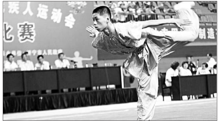
运动员流畅的动作赢得阵阵掌声。

在为期三天的比赛中,参赛选手相继进行了男子长拳、南拳、太极拳,以及女子对练项目的比赛。受卢传明夺首金的鼓励,在随后的比赛中,济宁代表队的残疾运动员越战越勇,最终在武术比赛中豪夺13金。