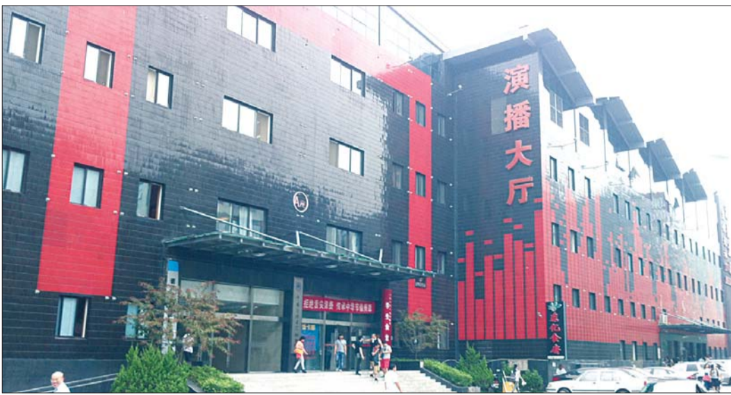
CCTV节目录制演播大厅

除此之外,营员们还将走进上海复旦大学,与梦想学府零距离接触,并在那里进行采风,与优秀学子交流,提前领略中国名校的风范,感受大学生活,细心体验名校学子那种自强不息的做事内力,兼容并包的作风,充分激发每个营员心中的“大学梦”、“名校梦”。