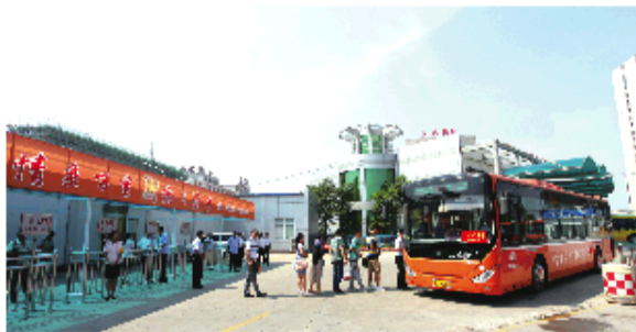
城际公交给市民的出行带来了很大的便利