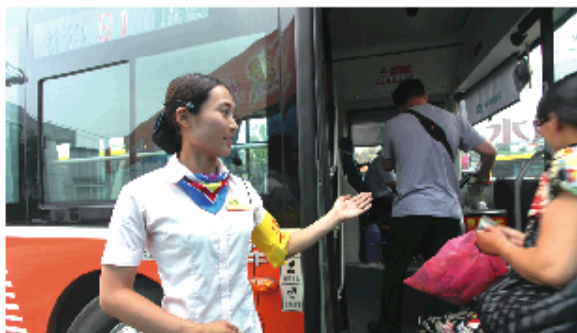
城际公交服务班的工作人员热情为乘客服务