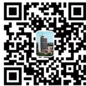
济南铁路局官方微信二维码

奖项设置:活动截止后,将随机抽取20名参与活动的热心旅客或网友,私信联系确认地址后,每人将获赠小米10400mAh移动电源1个,届时获奖名单将在济铁官微上公示。