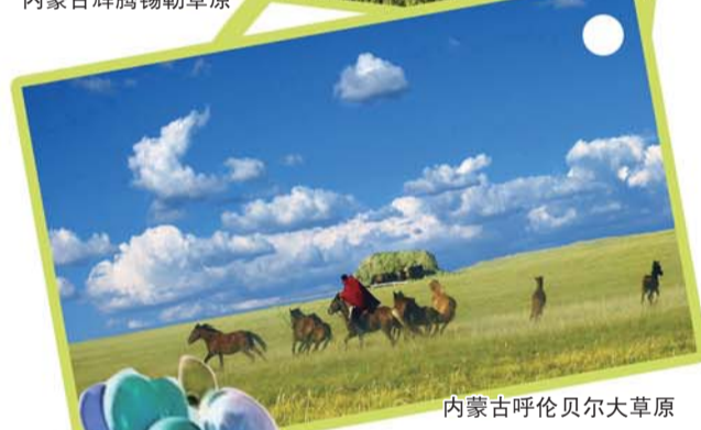
内蒙古呼伦贝尔大草原

漂流?冲浪?观瀑布?告诉你一个非同一般的避暑线路吧——到广阔无垠的大草原上找寻凉意,去感受绿波千里,风吹草低见牛羊的壮观景象,想象微风吹过脸庞,羊群、马匹如流云飞絮点缀其间,草原风光绚丽,令人心旷神怡,简直是不能抗拒。