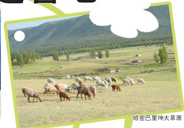
哈密巴里坤大草原