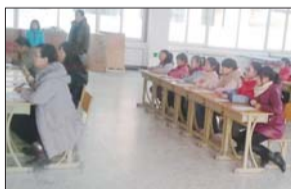
学生担任师生演讲比赛评委

在开放式办学理念推动下,鼎城小学积极尝试“互动”评价模式的推广,在学生、教师、家长之间进行各种形式评价,通过“我的课堂我做主”,“家校