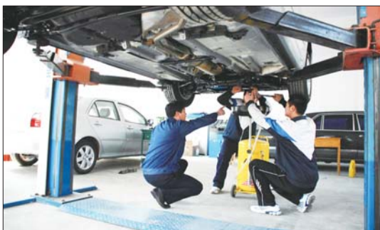
学生正在底盘构造与维修实训室上课。

“要达到优质就业这一目标,职业院校必须从新生入学开始,就特别注重树立学生的自信和目标。”尹桂瓚说,在现行的教育体制下,进入职业院校的学生,绝大部分在高考、中考和平时的考试中成绩属于中低层次,他们的心理比较脆弱,缺乏信心和目标。因此,学校的首要任务就是帮助学生树立信