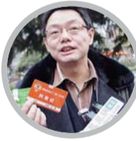
湖北省统计局 副局长叶青