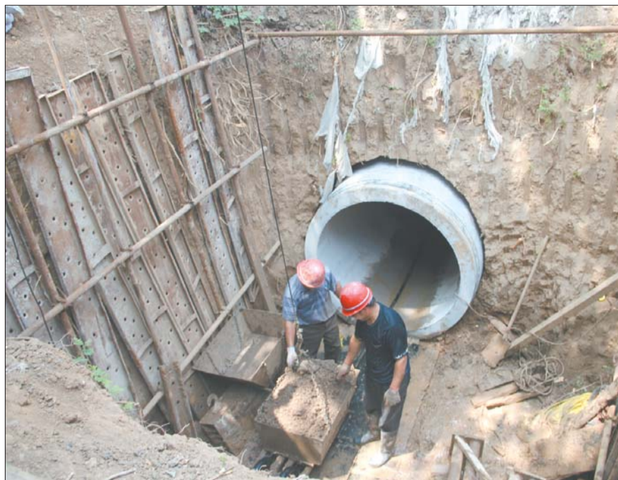
人工掘进,顶管施工。