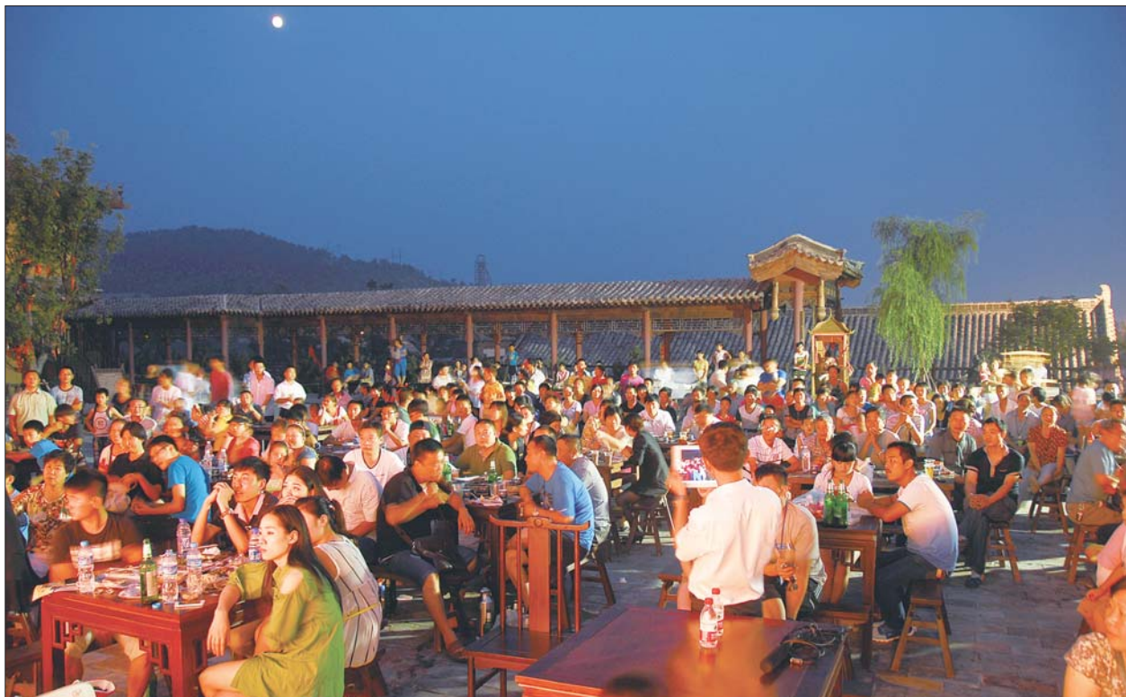
招远淘金小镇的消夏晚会很是热闹,不少游客前来避暑纳凉。

近日来的高温天气催热了烟台的“避暑游”,不少外地游客纷纷来烟台纳凉。烟台市旅游局也联合各大景点,依托避暑优势,开展消夏晚会,打造“烟台之夜”消夏游品牌,不少景区以消夏为主题的夜间休闲旅游项目悄然登场。然而,目前的夜间旅游仍以餐饮为主打,项目呈现单一性,并且游客多是外地人,本地市民不太感兴趣。