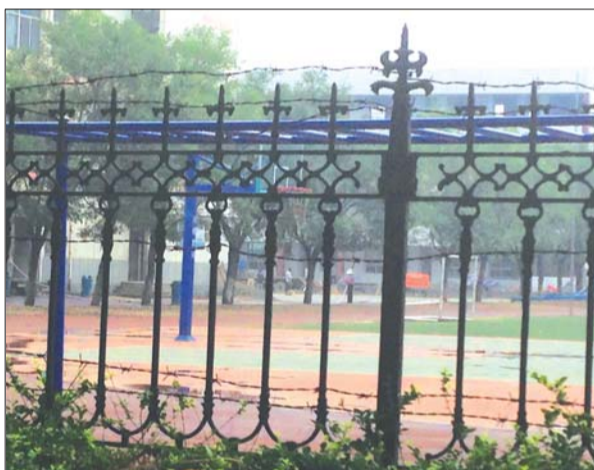
东岳中学北校正在施工,暂不对外开放,市民可去东岳中学南校区锻炼。

高新区一中和省庄一中也均对外开放,但在这两所学校活动的周边居民并不多。省庄镇一位居民说,在乡镇,大家对体育活动不是太喜欢,忙着上班一般都没时间去学校锻炼。