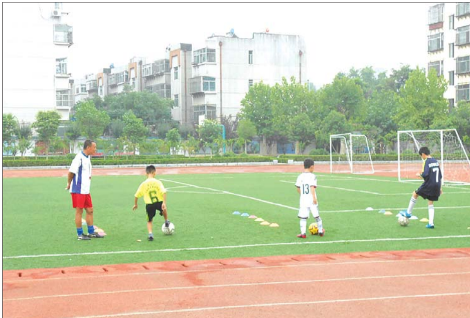
七里小学小学生正在踢足球。

在岳峰小学,记者可以直接进入校园,保安并没有阻拦,由于学校足球队正在集训,校园内只有学生和家