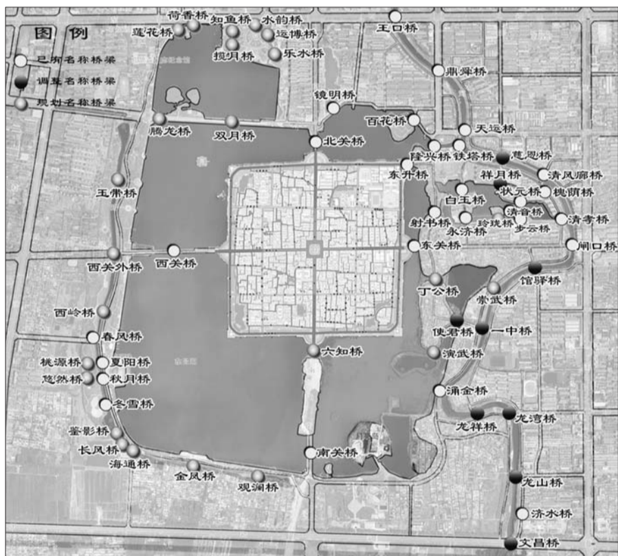
东昌湖风景区桥梁示意图。制图 边珂

因为有水,城市才显得灵动;因为有水,城市才变得脉脉含情。而桥,正演绎着水的情致,传递水的言语。城市的美丽正来源于每一座桥后面不朽的传奇。本次规划,东昌湖风景区内共有桥梁61座,其中已批准公布的有37座,新命名的桥梁24座。