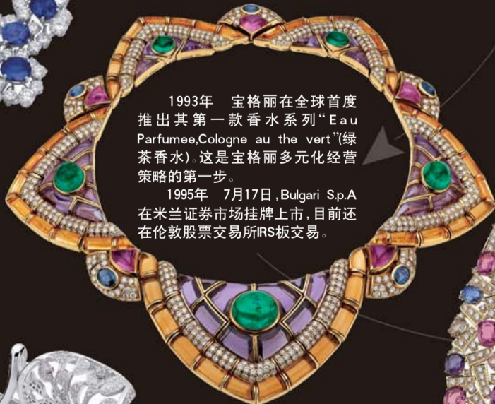
▲20世纪50-60年代 旷世奇珍代表作

1993年 宝格丽在全球首度推出其第一款香水系列“Eau Parfumée, Cologne au the vert”(绿茶香水)。这是宝格丽多元化经营策略的第一步。 1995年 7月17日，Bulgari S.p.A.在米兰证券市场挂牌上市，目前还在伦敦股票交易所IRS板交易。