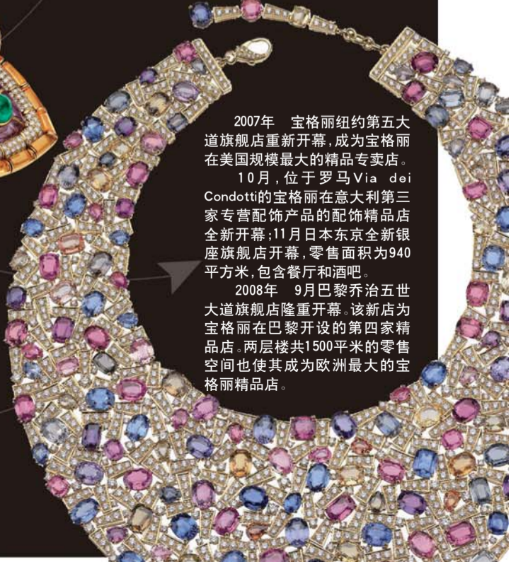
◀21世纪 顶级珠宝代表作

2008年 9月巴黎乔治五世大道旗舰店隆重开幕，该新店为宝格丽在巴黎开设的第四家精品店。两层楼共1500平米的零售空间也使其成为欧洲最大的宝格丽精品店。