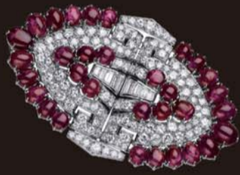
▲20世纪20-30年代 铂金钻石代表作