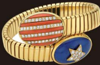
◀20世纪70年代 兼容并蓄代表作