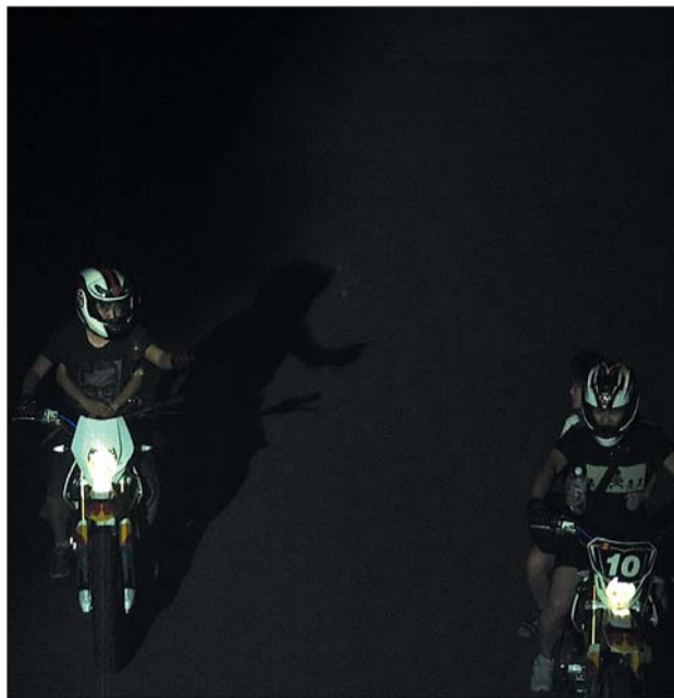
夜间街头光膀子飙车。视频截图