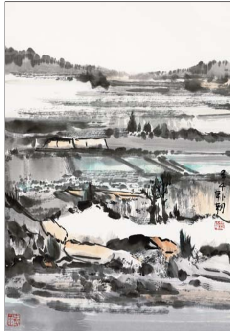
▲山水日记之东城 68x45cm 韩朝

美术类博士群体作为一个新兴群体，在各大展览上的“出场率”也比较低。王雅平说：“这是由于博士们定位为学术型画家，需要潜心研究学问，在学术上有一定成果后才能进行艺术交流。”这种较为低调安静的心态也更能促进美术类博士的创作和学术研究。而此次“古质今沿——全国艺术博士作品展”作为我省艺术圈里首个博士展，不但反映了艺术院校的高端教育水平，也显现了中国绘画艺术的发展与延伸。参展艺术家们也表示，此次博士展在书画博览会上展出意义非凡，博览会受众面广，参展层次多样，观众层次也十分丰富，观众们不同的欣赏角度、审美取向、观点分歧，将对参展艺术家有很大的启发，而观众也将在博士这个特殊的创作群体里欣赏到中国画的多维度展现。