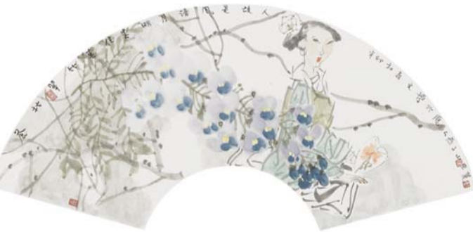
▲明月清风是故人 扇面 梁文博

参与本次博览会的众多名家中,梁文博善于在平凡的日常生活中发掘人性之美、生活之美。他的小品画精致入微,仕女、花草,都可以