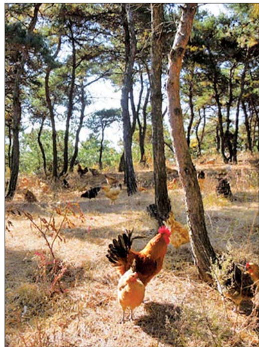
农场里奔跑的鸡群是绝对主角。