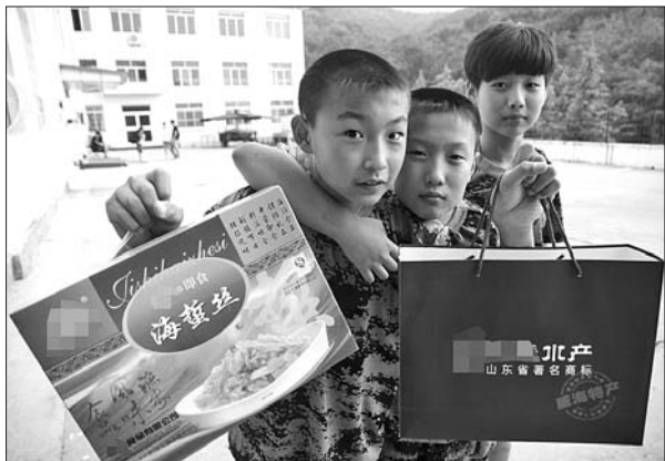
▲26日,孩子们挥手告别军营,留下灿烂的笑脸。