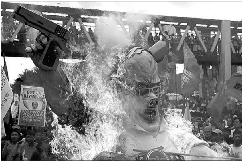
菲律宾示威民众火烧阿基诺人偶。

据菲律宾媒体报道,菲律宾总统阿基诺三世28日发表国情咨文,呼吁全国支持其改革。值得注意的是,阿基诺在国情咨文中只字未提南海。当天,数千名示威者在奎松市沿着联邦大道国会大楼前进,反对阿基诺的政策,表达抗议。