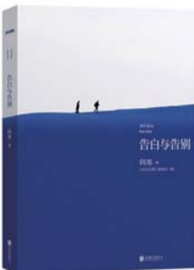
《韩寒:告白与告别》 作者:韩寒 出版社:北京联合出版公司 出版时间:2014年8月1日

相比《小时代》系列出书已久,趁电影大卖再版捞金,《后会无期》的幕后故事和韩寒转型为导演的心路历程则是首次见诸笔端。7月1日出版的《一个4:不散的宴席》中收录的《韩寒:励志故事》和即将于8月1日出版的《告白与告别》都聚焦在电影《后会无期》创作和拍摄中的故事。