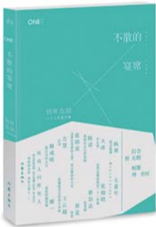
《一个4:不散的宴席》 主编:“一个”工作室 出版社:作家出版社 出版时间:2014年7月1日