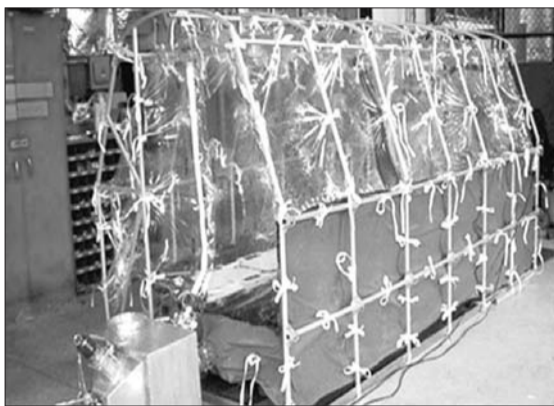
接感染者回国治疗的飞机上所使用严密隔离的箱子。

埃默里大学医院公共卫生专家菲利普·布拉赫曼医生说,在动用所有现代手段情况下,两名患者在安全的环境下会表现更好,“这是我们能为他们做的事情”。 据新华社等