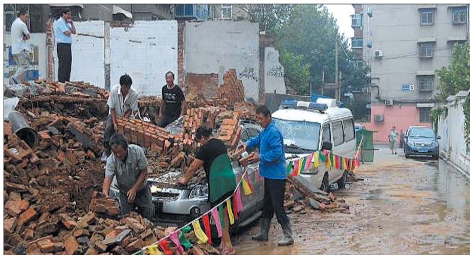
一位车主在清理车上的砖块。

四月份为了方便修建操场建的。围墙建好后,这里又被划上了停车位,每天都停得满满的,都是附近居民的车。