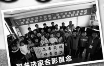
和书法家合影留念