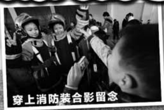
穿上消防装合影留念