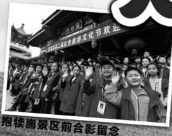
抱犊山景区前台合影留念