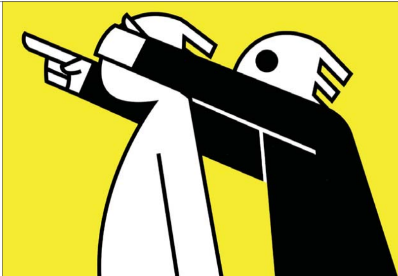
人与人之间的信任危机让我们虚耗了太多的社会成本。

莱克斯·德文斯基是当代世界漫画和设计界的顶尖人物之一。他于1951年出生在一个波兰的德国裔家庭,在波兰波兹南大学从著名艺术家斯维斯基教授。1983至1985年德文斯基成为波兹南大学动画电影工作室艺术总监。1985年德文斯基举家离开波兰,定居在当时的西柏林,在那里他成为专业设计师,同时为德国希姆达特动画公司设计动画造型并撰写剧本。1992年德文斯基成为德国波兹南大学艺术教授,在那里他参与了多项国际漫画大展,并融合漫画艺术与设计艺术形成了所谓德文斯基流派的设计学派,并广为世界各国关注,应邀在柏林、巴塞罗那、马德里和纽约举办了多场个人艺术展览。在2000年,德文斯基入选二十世纪最具世界影响的世界设计艺术大师之列,在巴黎接受了授予他的终身艺术成就奖。德文斯基还在2004年作为特邀嘉宾应邀出席了在北京举行的第六届世界漫画高峰论坛。(大川)