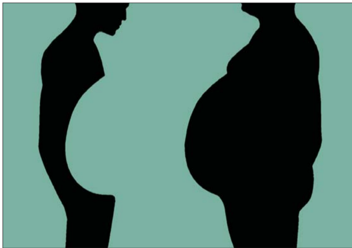
炒票是一种“合法”的掠夺