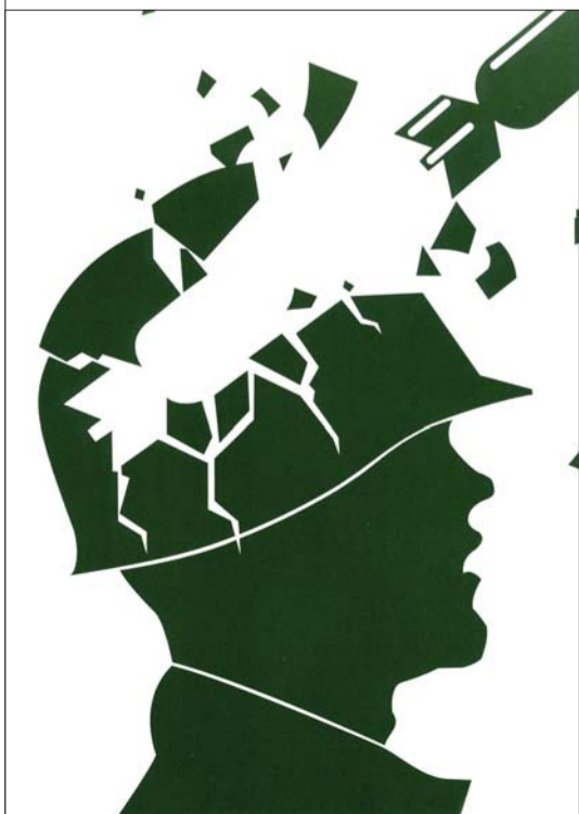
战争使人类所付出的代价不是战争本身可以承载的。