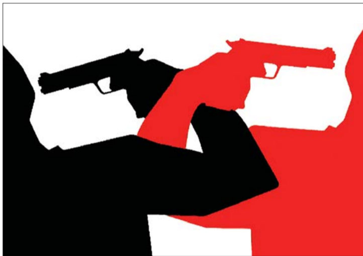
有多少背信弃义是打着友谊的幌子呢?