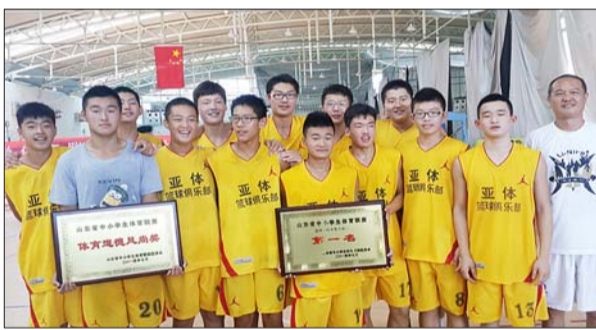
8月12日,山东省中小学生体育联赛篮球初中组比赛结束,最终济南五中男子篮球队九战九胜获得冠军。