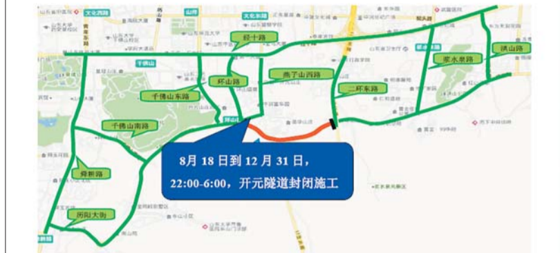
开元隧道施工期间车辆绕行图。

确定舜耕路、千佛山南路、千佛山东路、环山路、燕子山西路、经十路、二环东路、浆水泉路、洪山路等道路为分流路线。