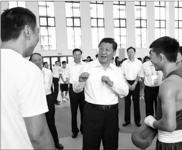
习近平看望青奥会中国代表团,与拳击运动员亲切交流。

第二届青奥会将于16日在南京开幕,习近平将出席开幕式。来自204个国家和地区的3787名运动员将参加比赛,同时参加丰富多彩的文化教育活动。参赛运动员是15至18岁的青少年。