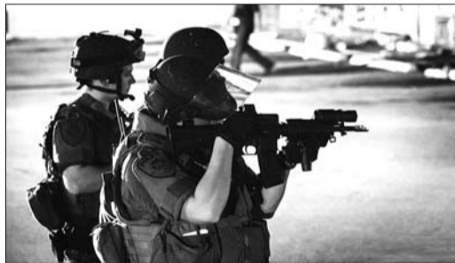
8月18日,弗格森街头,警方在与示威者对峙。