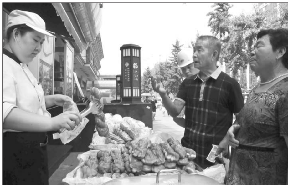
中心大酒店摆摊卖麻花、馅饼、馒头等,吸引了不少市民前来购买。

大酒店就已开始了餐饮业的转型之路。“去年整个高档餐饮业的行情不景气,酒店也敏锐地感觉到了转型的必要,当时单独开辟了一块地方,建了个外卖服务厅。”烟台中心大酒店配餐开发部经理王莉介绍。