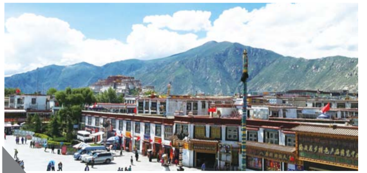
从大昭寺眺望,远处的布达拉宫壮美依旧。