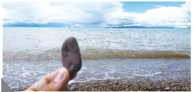
纳木错滩边众多石子,千百年来一直在守望这天海一色。