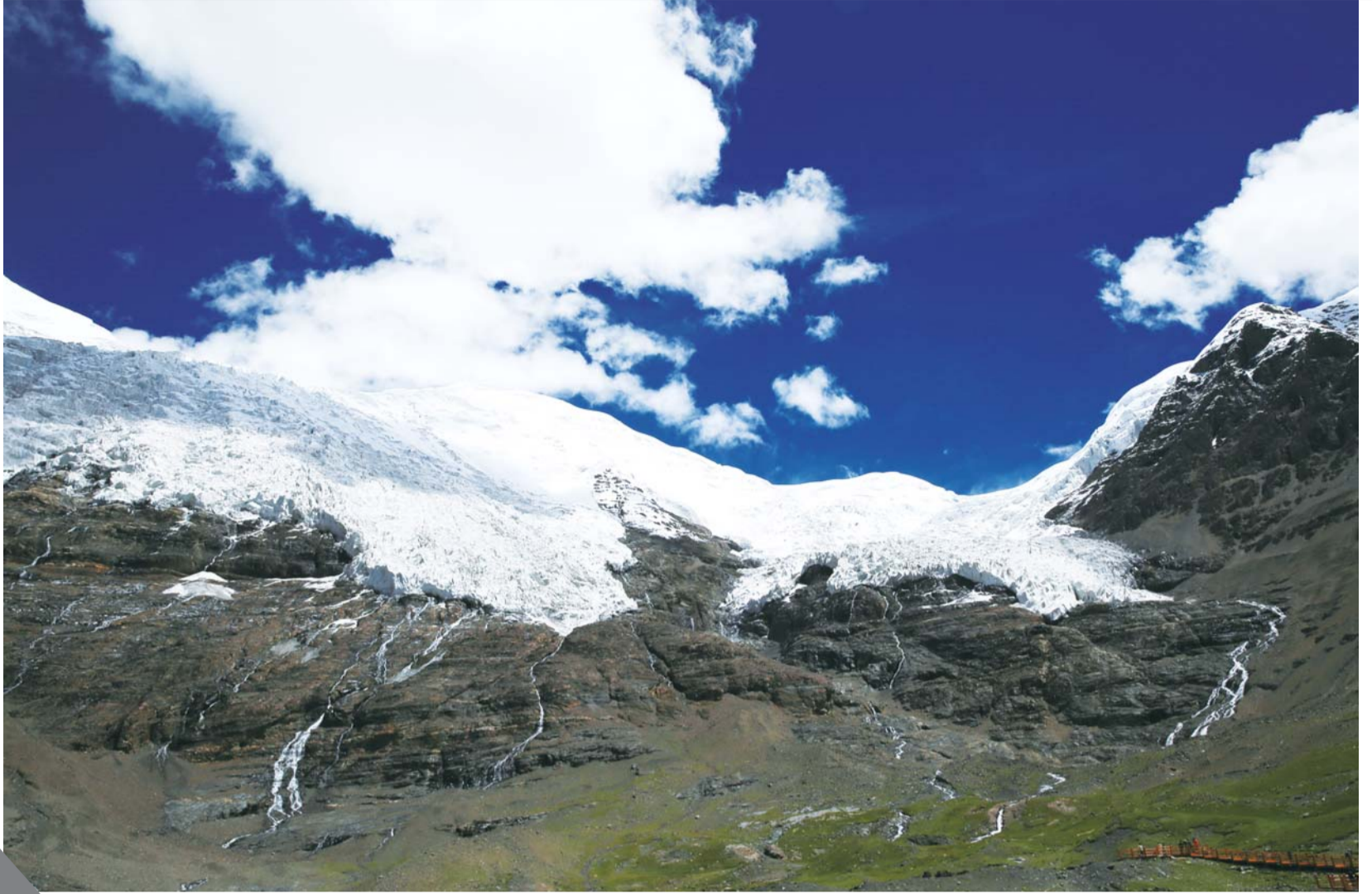
卡罗尔冰川,十五年后会因温室效应融化,我们不想说再见。