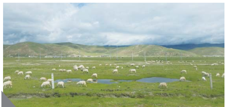
可可西里大草原,有了羊群,便不再孤单。