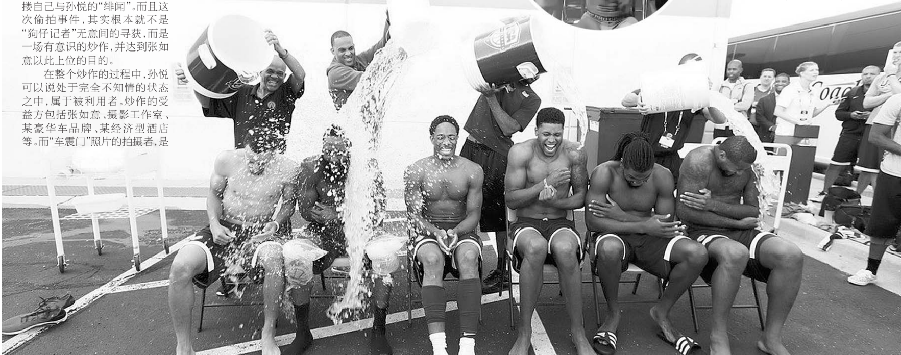
▼美国男篮集体接受冰桶挑战。

该活动旨在让更多人知道被称为渐冻人的罕见疾病,同时也达到募款帮助治疗的目的。目前“ALS冰桶挑战赛”在全世界科技大佬、企业家、影视明星和职业运动员中风靡。