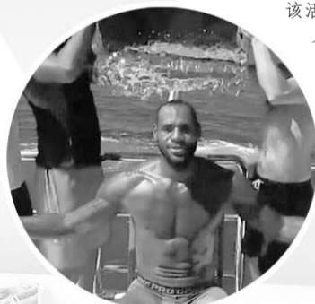
▶詹姆斯坦然面对冰桶。