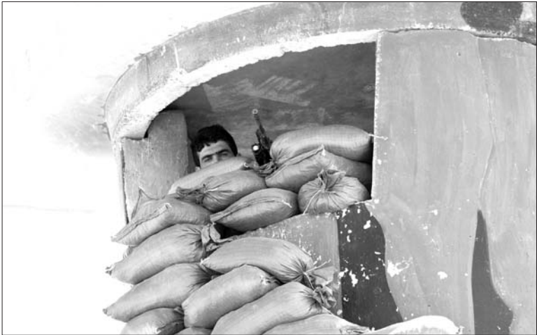
23日,在伊拉克北部基尔库克通往提克里特公路边的一个碉楼里,一名库尔德武装人员密切关注着“边界”附近极端武装的动向。