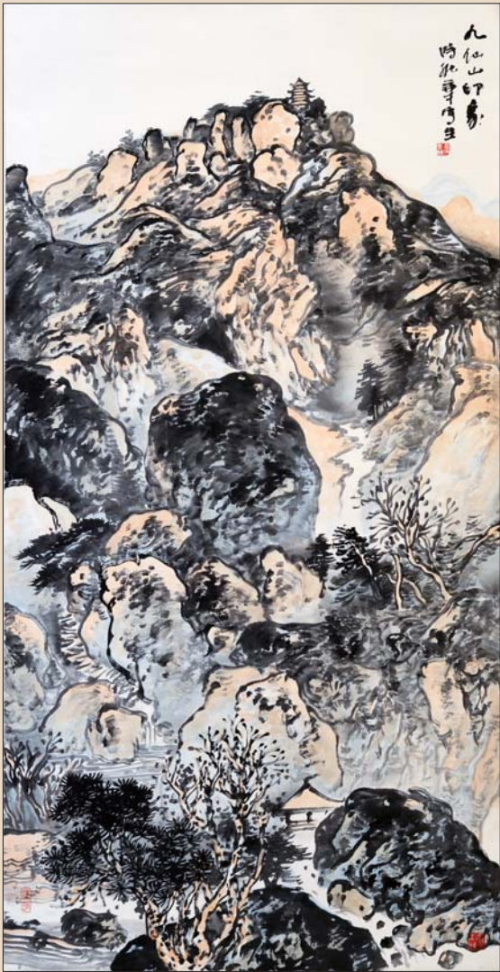
▲九仙山印象 时振华