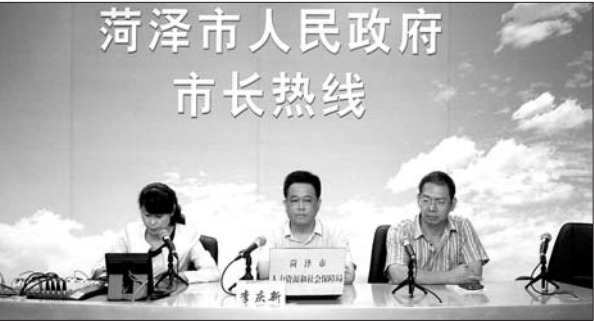
菏泽市人社局做客市长热线现场。