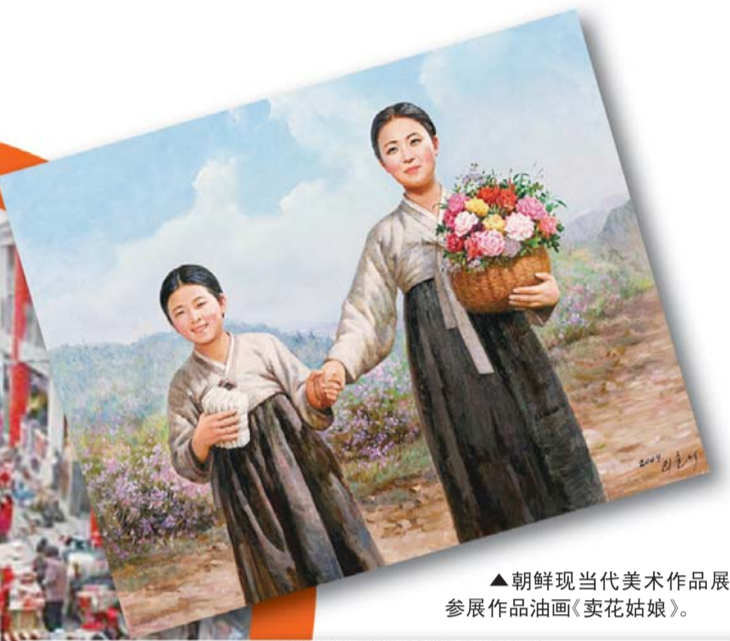
▲朝鲜现当代美术作品展参展作品油画《卖花姑娘》。