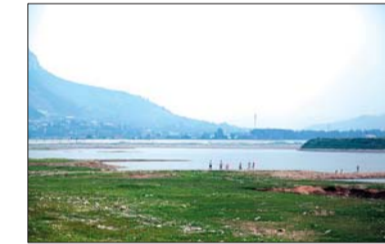
裸露的库底长满了青草。

另据水利局工作人员介绍,若近期南部山区没有有效降雨,水库水位会继续下降,蓄水量会持续减少。