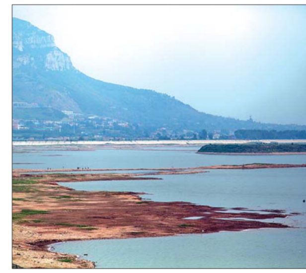
水位大幅下降,裸露的库底延伸很远。