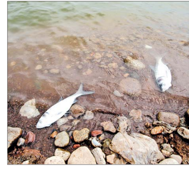
水库里很多鱼缺氧而死。