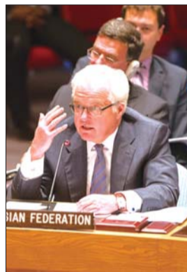
俄罗斯常驻联合国代表丘尔金

朝鲜近期寻求加强与俄罗斯的关系。朝鲜媒体对两国领导人互发贺电,经济代表团相互访问多有报道。韩媒本月25日报道称,朝鲜最高领导人金正恩寻求8月底或9月初访问俄罗斯,与俄总统普京会晤,以期加强朝俄关系。如果成行,这将是金正恩掌权两年多来首次出访。不过,俄罗斯外长拉夫罗夫随后予以否认。