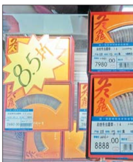
济南一家商场打85折促销虫草礼盒。

中心医院的吴医生介绍,“大小对药效影响并不太明显,我们不会将虫草列为治疗药物,顶多是建议,况且也有相对应的替代品,不见得非得用虫草,而过贵的大虫草就更没有必要了。”