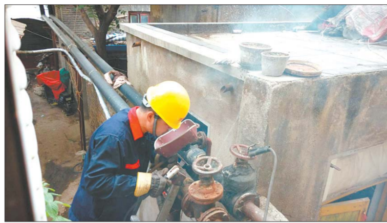
为了迎接供暖季,济南各大供热公司正在抓紧抢修(资料片)。