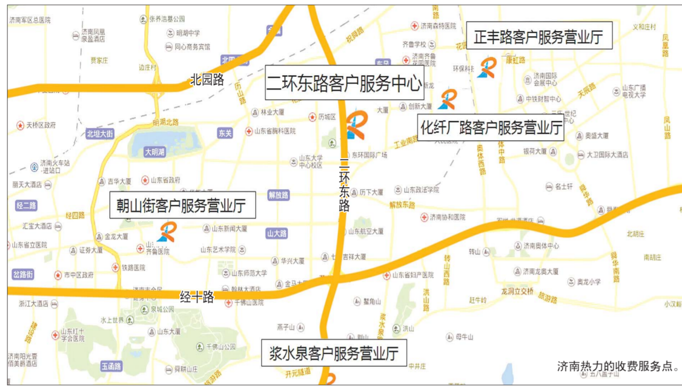
济南热力客服大厅位置

山东省物价局于8月28日下发文件,称居民用户按照用热量收费数额超过按照供热面积收费数额的,其超过部分的收费上限,由设区的市、县(市)人民政府确定。“未出台具体标准的,供热企业按照用热量收费数额不得超过按照面积收费数额。”省城一家热企工作人员向记者介绍,“如果物价