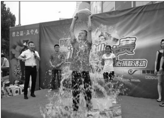
银座杯冰桶挑战赛。

活动结束,共有30名爱心人士参加挑战,本次活动银座商城总共向儿童福利院捐赠2000元。(张超)