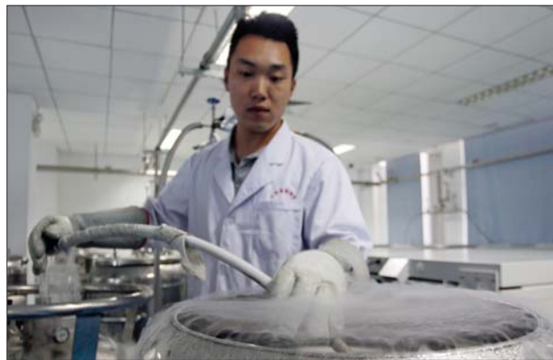
省脐血库工作人员将液氮注入临时储罐内。

目前山东省内经国家卫生计生委批准设立,获得《血站执业许可证》的脐血库仅有位于济南的山东省脐血库一家,同时也是我省唯一具有脐带血采集保存及临床供应资质的脐带血干细胞科研机构,市民选择需注意。