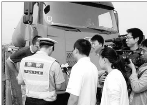
9月6日10时许，我省开出首张危险品运输车辆违反禁令上高速罚单。