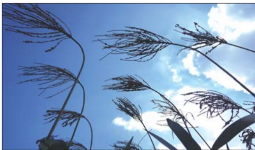
钢雕“红高粱”在蓝天白云的掩映下几能乱真。