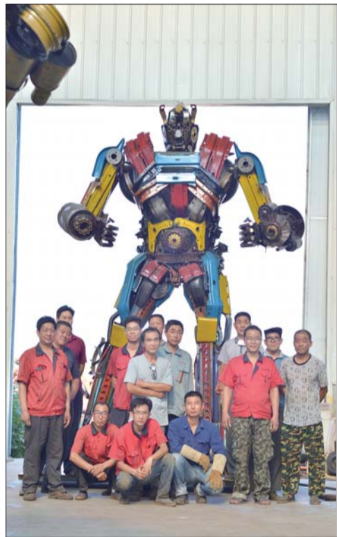
“变形金刚”和它的制作者们合影。