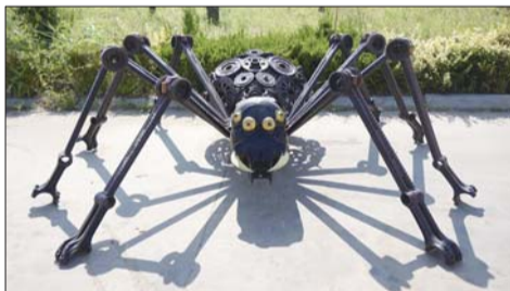
经过精心设计，锈蚀的废旧材料变成了蜘蛛。