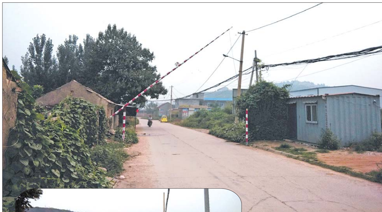
◀大庙屯村入口设置了限高杆,防止渣土车乱倒渣土,轧坏道路。