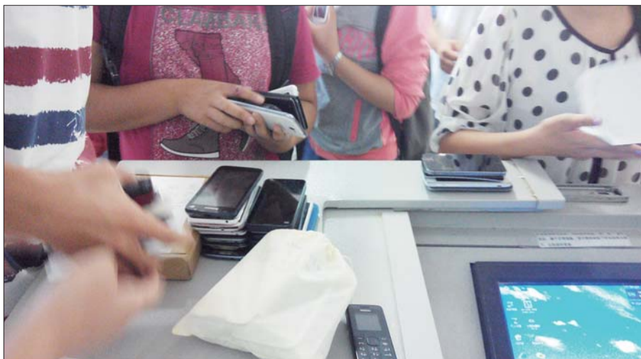
下课后学生们取回手机。