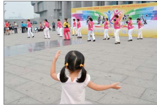
场下观战的小朋友也跟着手舞足蹈起来。