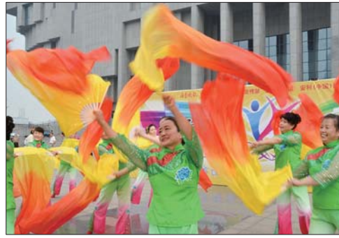
从欢快的舞姿中丝毫看不出舞者年龄。