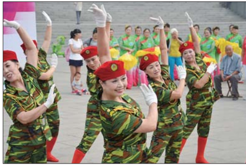
舞蹈队员的动作整齐划一。

由30人组成的十亩园金秋梦之队最后压轴出场,整齐划一的动作再加上神曲“小苹果”伴奏,将整个比赛带入了高潮,场下掌声,喝彩声不断。虽然没能入围下一轮,但是队员们的表演却给观众带来了欢乐。大红色的表演服,整齐划一的动作,引来观众的阵阵掌声。