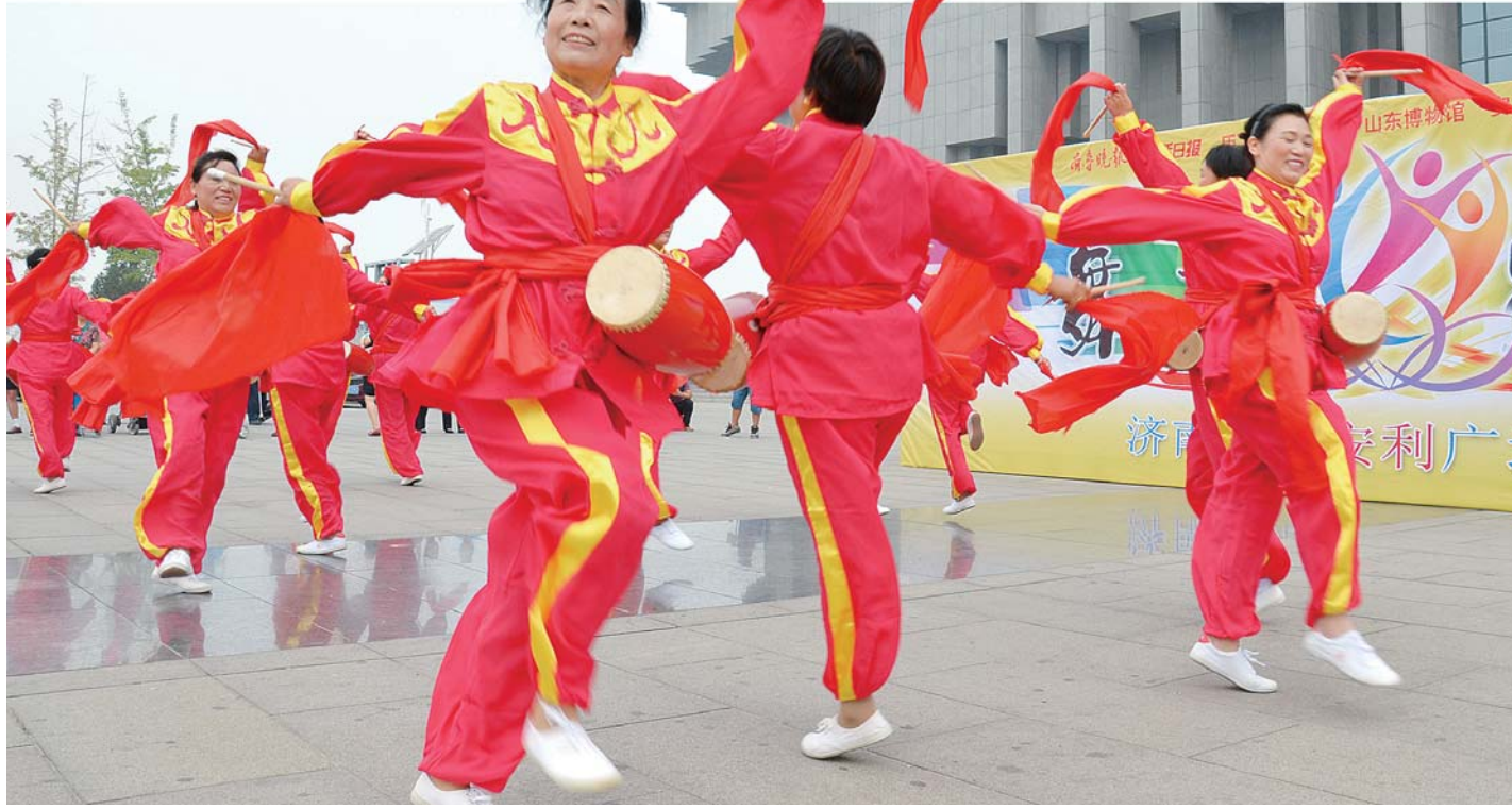
传统锣鼓也编排成了广场舞。