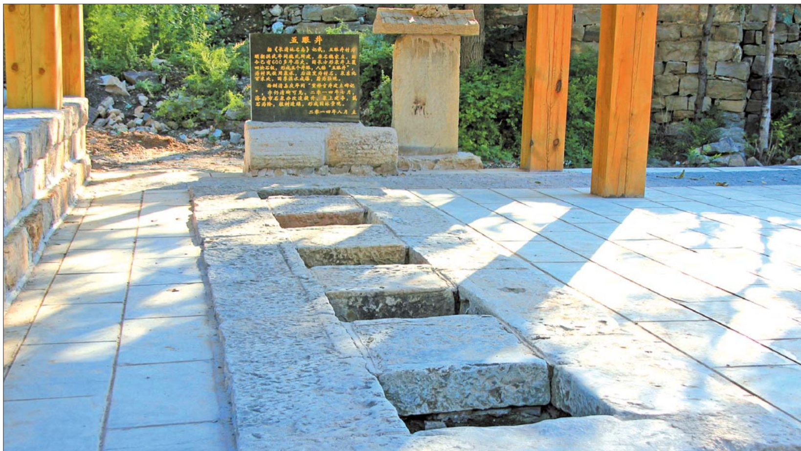
五眼井村因这五口井眼而得名。