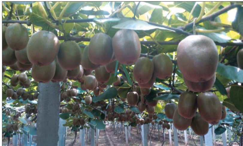
博山源泉猕猴桃已经成熟,欢迎订购、采摘。

博山区源泉镇是国家特级水源保护地,土质优良,昼夜温差大,种植猕猴桃具有得天独厚的优越条件。猕猴桃口感纯正,个小味美,酸甜适度,细嫩多汁。