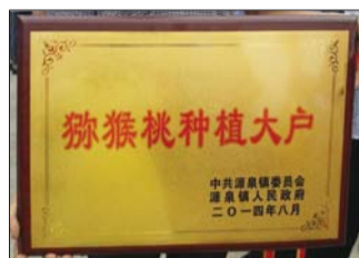
该公司获得“猕猴桃种植大户”荣誉称号。

该公司还建成了高标准有机猕猴桃质量安全监测站,严格规范有机猕猴桃生产、加工、销售和检测标准,推动有机猕猴桃生产标准化,确保博山猕猴桃的产品品质和安全。